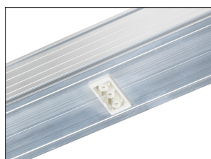
PDNA + WFC1 IP20