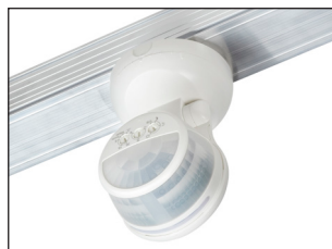
PDNA + BW-S IP20 - 40