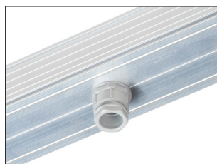
PDNA + PG16 IP20 - 65