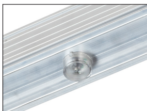
PDNK + OSR IP20