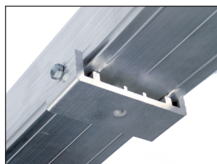
BM3 IP20 - 54