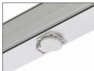
PDNA + WCDR IP20 - 44