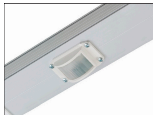
PDNA-MD-L-N + PB coupler