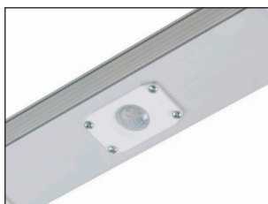
PDNA-MD-L-N-R IP20 - 54